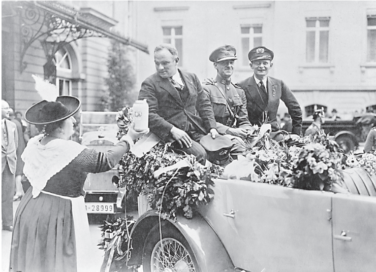
Die Ozeanflieger im Ehrenhof des Reichskanzlerpalais in der Wilhelm- straße, 20. Juni 1928.

zu nehmen und mit hochrangigen Vertretern und Spitzen der Behörden und Unternehmen zusammenzutreffen. Dabei brandete der Jubel der Berliner auf, und die Gesänge, die die etwa 3.000 Schulkinder anstimmten, klangen zur Flughalle hinüber. Sie machten sichtlichen Eindruck auf die Flieger.