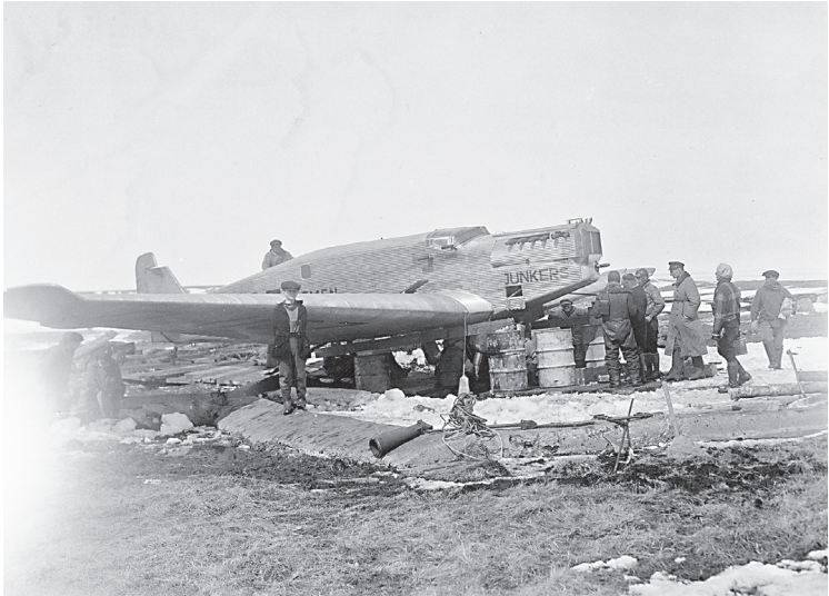
Die bei der Landung auf Greenly Island beschädigte »Bremen«, 20. April 1928.

Dampfer nach den Azoren. Viele verschwanden leider Gottes in den Wellen oder in den eisigen Regionen des Nordens.« 1 Damit erfasste er zugleich die Gefühls- und Spannungslage, mit der viele Menschen, nicht nur Flieger und Flugbegeisterte, die Entwicklung der zivilen Luftfahrt nach dem Ende des Ersten Weltkriegs verfolgten. Charles Lindbergh gelang im Mai 1927 der erste Nonstopflug von New York nach Paris. Das Unternehmen Köhls, von Hünefelds und Fitzmaurice von Irland nach Neufundland über den Nordatlantik erfolgte hingegen auf der meteorologisch schwierigeren Ost-West-Strecke. Ihr Flug wurde in Amerika und in Deutschland ebenso gefeiert wie zuvor der große Erfolg Lindberghs. Dennoch sind die Empfänge der Transozean-