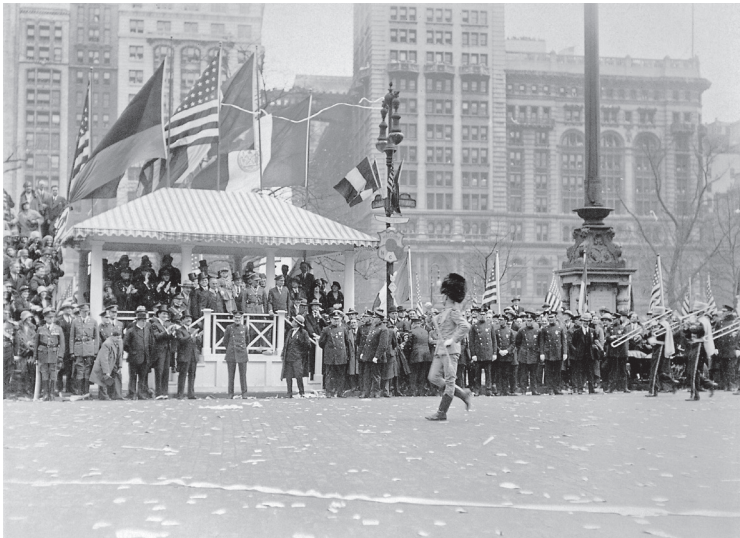
Parade im Madison Square Park, 30. April 1928.

anstaltungen im alten Rom geboten haben müssten. Wichtig war ihm, dass die New Yorker klar erkannt hätten, dass ihr Flug kein »stunt« war, »but rather a scientific endeavor«. Denn sowohl Transport, aber vielmehr noch die schnelle Kommunikation mit Flugzeugen über den Atlantik, ja alle Meere hinweg, sei ein zentraler Bestandteil der künftigen Entwicklung der Welt. Abschließend betonte er, dass der Flug auch zur Völkerverständigung beigetragen habe und die Bande zwischen den USA, Deutschland und Irland fester knüpfen helfe. Zum Abschluss des Empfangs wurden die Nationalhymnen gespielt. 10