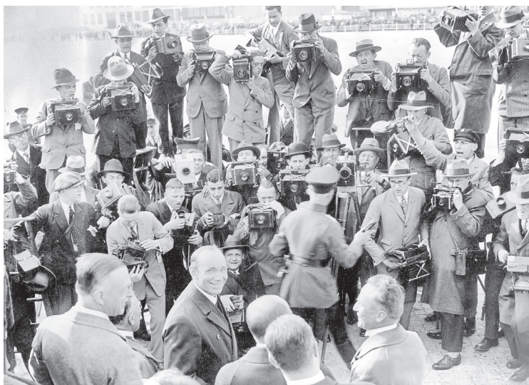
Pressefotografen umringen die Nordpolfieger, Mai 1928. Im Vordergrund George H. Wilkins.

Abteilung der Aeroarctic 34 , den amerikanischen Botschafter in Berlin Jacob Gould Schurman zu bitten, die Flieger in die Reichshauptstadt einzuladen. Schurman stellte sich prompt hinter das Vorhaben. Gemeinsam mit der Aeroarctica, dem Amerikanischen Club sowie der Associated Press und mit Unterstützung der Reichsregierung lud Schurman Wilkins und Eielson nach Berlin ein. Der Magistrat, der zunächst noch hoffte abwarten zu können, geriet nun zusehends unter Handlungszwang. Als Wilkins sein Kommen für Anfang Juni ankündigte, blieben dem Reichsinnenministerium und dem Magistrat etwa