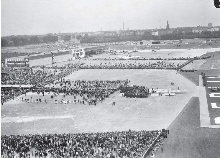
Empfang der Ozeanflieger auf dem Flughafen Tempelhof, 20. Juni 1928.

haben wir ihren Flug verfolgt, ihre Landung drüben bejubelt und ihrer Ehrungen uns gefreut.« 41