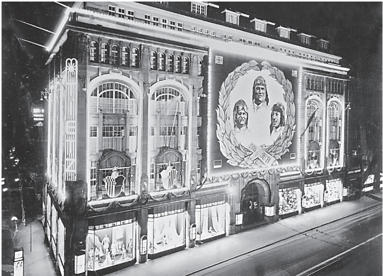
Lichtreklame am Berliner Warenhaus Hermann Tietz zur Begrüßung der Ozeanflieger, Juni 1928.

die Wagen in den Vorhof ein, wo bereits die Fotografen warteten. Im Nu waren Köhl, von Hünefeld und Fitzmaurice umringt. Bayerische Frauen in ihrer Heimattracht reichten Bierkrüge. Kurzerhand beugte sich unvermittelt von Hünefeld vom Auto und gab einer Bayerin einen lauten Kuss. »Versöhnung zwischen Bayern und Preußen!«, rief er lachend in die Menge.