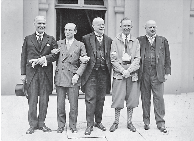
Empfang von Clarence D. Chamberlin und Charles A. Levine im Garten der Reichskanzlei in Berlin, 7. Juni 1927. V.l.n.r. US-Botschafter Jacob G. Schurman, Levine, Reichskanzler Wilhelm Marx, Chamberlin, Reichsaußenminister Gustav Stresemann.