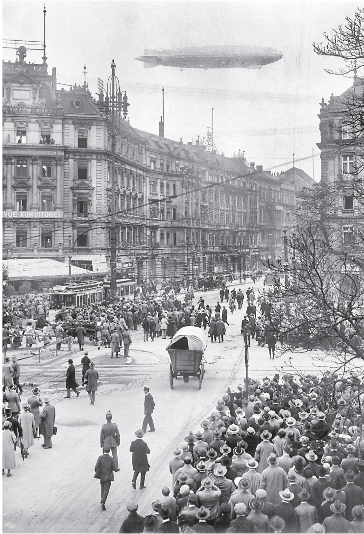
In Berlin beobachten Schaulustige den Überflug des Luftschiffs LZ 126 (ZR III »U.S.S. Los Angeles«), September 1924.