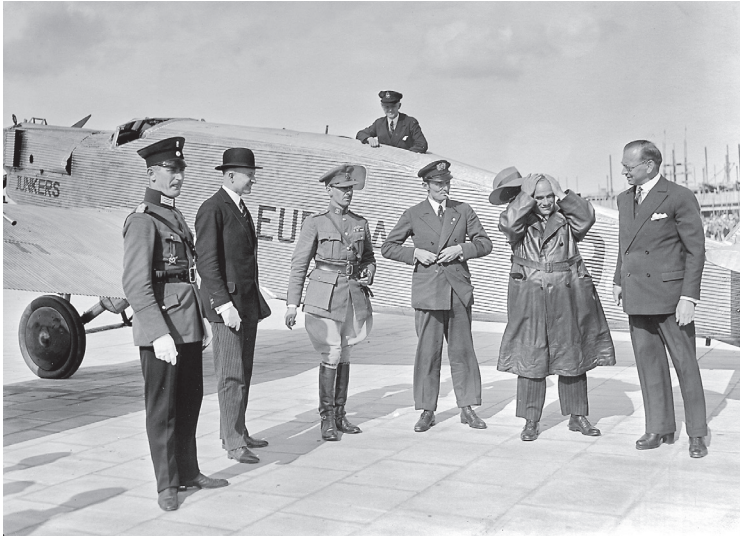
Zwischenlandung der Ozeanflieger Köhl, von Hünefeld und Fitzmaurice in Hamburg, 20. Juni 1928.

ein Irländer, deren Namen und Ruhm seit vielen Wochen die Welt erfüllen, sind heute in die Hauptstadt des Reiches gekommen. Die beiden Völker, zu denen sie ihr tapferer Flug über den Ozean brachte, in Kanada und in den Vereinigten Staaten, haben ihren Enthusiasmus über die sportliche Leistung und ihre Freude an den kühnen Männern in Jubel und Ehrungen gezeigt. Wer es in Amerika miterlebte, [...] der weiß, dass die Begeisterung, die diese deutsche Friedenstat Köhls und Hünefelds drüben auslöste, echt und herzlich war. Und umgekehrt: dass es gerade diese beiden Deutschen waren, die als erste nach dem Kriege auf dem amerikanischen Nationalfriedhof bei Washington einen Kranz mit den deutschen Farben am Grab des amerikanischen ›Unbekannten Soldaten‹ niederlegten, soll dem Volk der Vereinigten Staaten ein Beweis sein, dass sie als Boten der Völkerfreundschaft in seiner Mitte sich fühlten. Als solchen haben wir in Deutschland sie angesehen, so