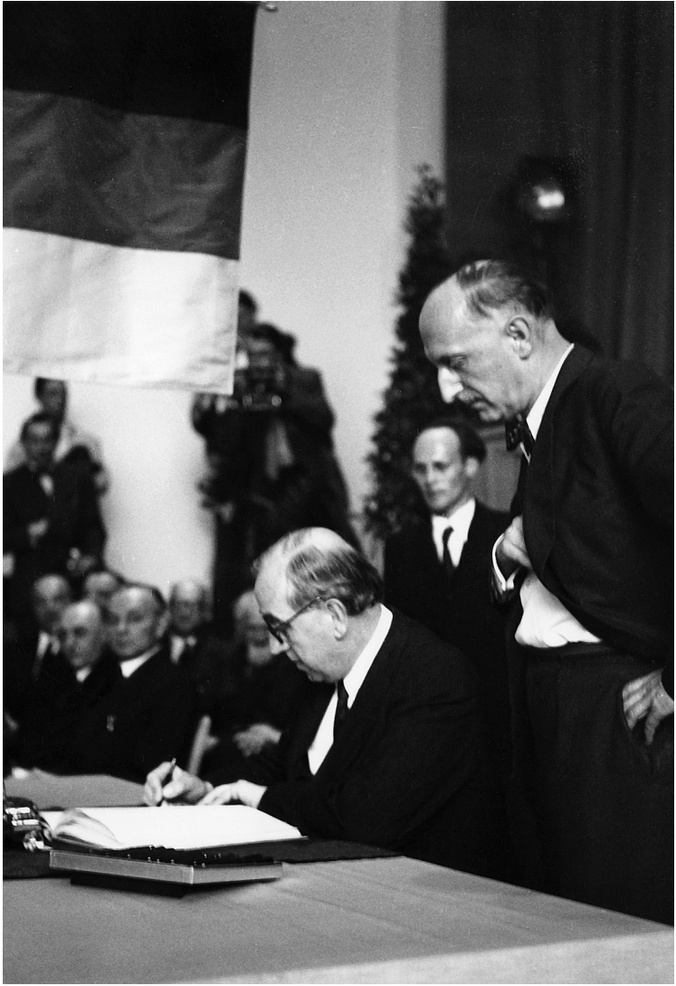
Als Oberbürgermeister von Berlin unterzeichnet Ernst Reuter am 23. Mai 1949 das Grundgesetz. Hinter ihm der Vorsteher der Stadtverordnetenversammlung, Otto Suhr (SPD).