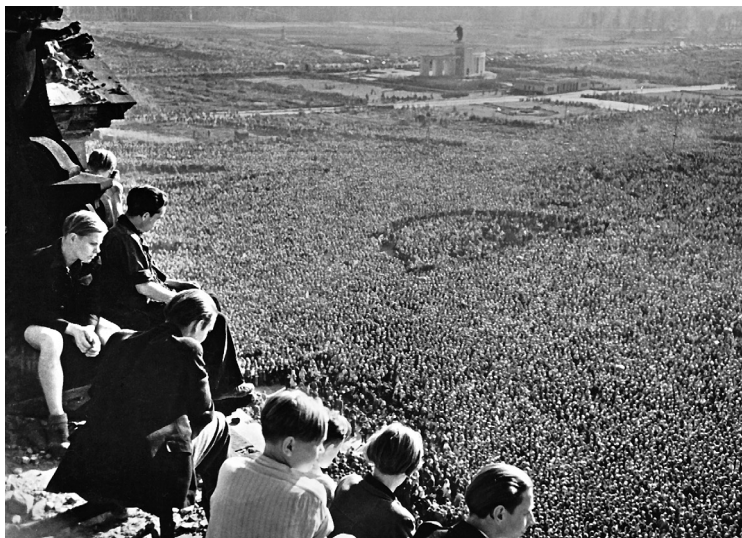
Freiheitskundgebung »Berlin ruft die Welt« auf dem Platz der Republik am 9. September 1948.

Diese Auffassung des Kalten Krieges findet sich beispielhaft in einer Rede, die Reuter am ersten Tag der Blockade auf einer sozialdemokratischen Kundgebung im Wedding gehalten hatte: »Berlin ist aus eigener Tatkraft und durch die Haltung seiner Bevölkerung wieder der Punkt geworden, um den alle Deutschen in Ost und West sich orientieren. Es ist die Stadt geworden, von der niemand mehr bezweifeln kann, daß sie, wenn der Tag des Abzugs der Besatzungsmächte aus Deutschland gekommen sein wird, die Hauptstadt eines einigen, eines in Freiheit einigen Deutschlands sein wird. [...] Wir wissen [...] ganz genau, daß wir ein waffenloses, besiehtes und im Grunde genommen einstweilen auch ein wehrloses Volk sind. Unsere Stärke liegt nicht in unserer äußeren Kraft, die ist uns genommen worden. [...] Unsere Stärke liegt heute in Berlin nur darin, daß wir eine gute und gerechte Sache vertreten. Unsere Stärke liegt darin, daß wir für die Freiheit unseres Volkes, für