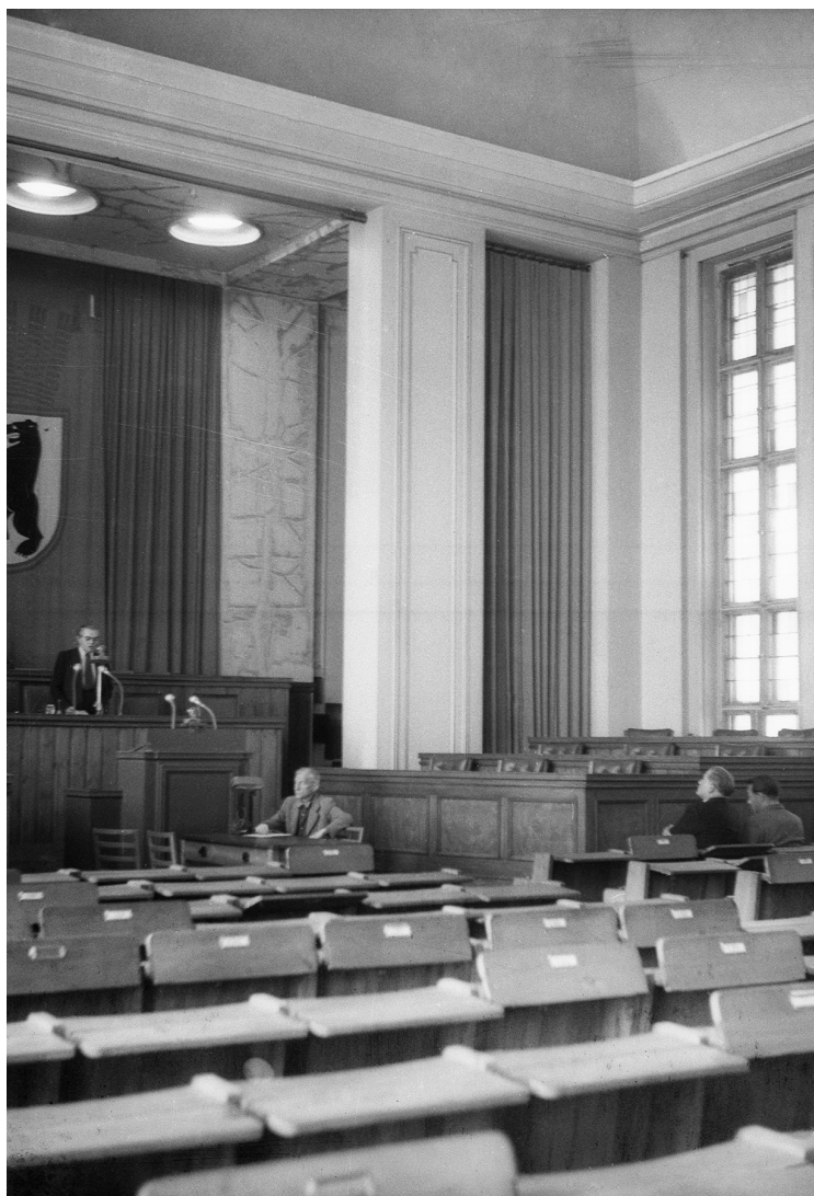
Nachdem die Fraktionen der SPD, CDU und LDP die Stadtverordnetenversammlung am 6. September 1948 verlassen haben, spricht Ottomar Geschke (SED) vor den wenigen verbliebenen Abgeordneten.