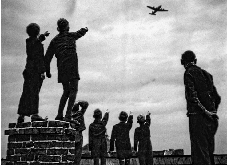
Berliner beobachten die Luftbrückflugzeuge, 1948/49.

Berlin nahegelegen, wie er auch erwogen wurde. Doch machte die zu erwartende negative Signalwirkung auf die Deutschen in den Westzonen und auf die Europäer im Westen des Kontinents einen solchen Schritt – umso mehr, wenn er nicht freiwillig erfolgte – untragbar. Die Westsektoren Berlins mochten insofern von den USA auch als Falle empfunden worden sein. Die Westmächte mussten daran interessiert sein, eine Zuspitzung der Auseinandersetzungen in und um Berlin zu vermeiden, solange die Dinge im Westen Deutschlands in der Schwebe waren. Und tatsächlich bemühten sie sich in der zweiten Juni-Hälfte 1948 um Verhandlungen mit der Sowjetunion. Dabei gingen sie sogar soweit, die Einbeziehung ganz Berlins in das Währungsgebiet der Ost-Mark anzubieten, sofern die Währung unter eine Vier-Mächte-Aufsicht gestellt würde. Doch nicht einmal das wollte die sowjetische Seite zugestehen, geschweige denn eine separate Gesamtberliner