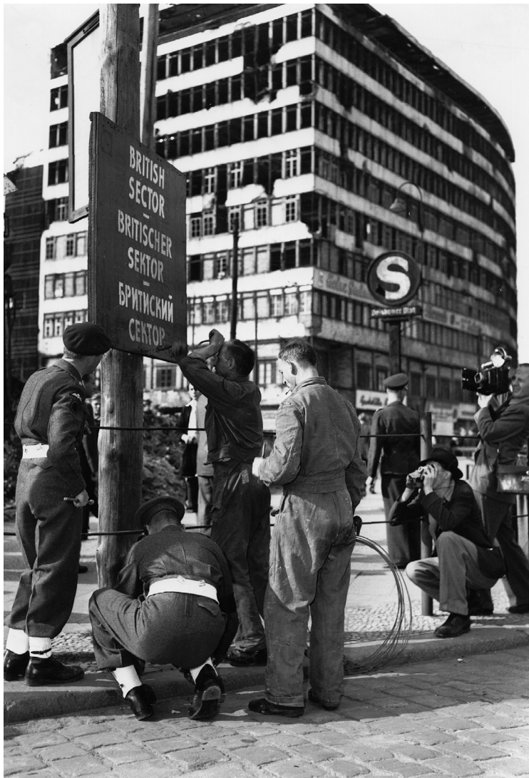
Markierungsarbeiten an der Sektorengrenze am Potsdamer Platz, um 1948.