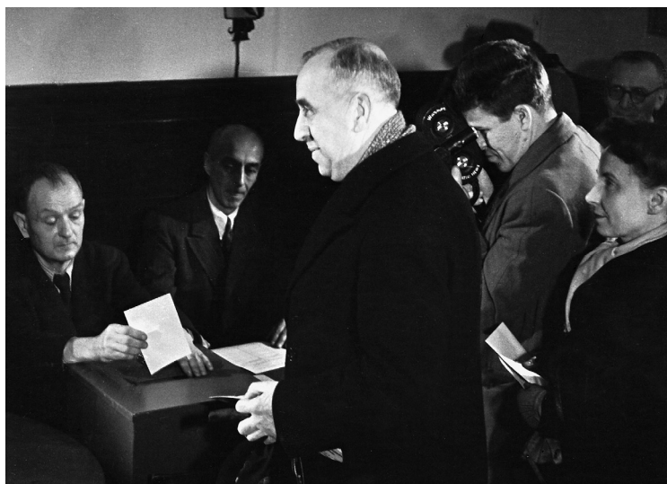
Ernst Reuter bei der Stimmabgabe am 5. Dezember 1948.

wurde. Reuter hatte jedoch noch mehr gewollt, nämlich die volle Einbeziehung Berlins (de facto West-Berlins) in die Bundesrepublik, für die er noch im Frühjahr 1949 bei den Westalliierten vergeblich geworben hatte. Nicht zuletzt daran wird nochmals der offensive Charakter von Reuters deutschland- und berlinpolitischer Linie deutlich.