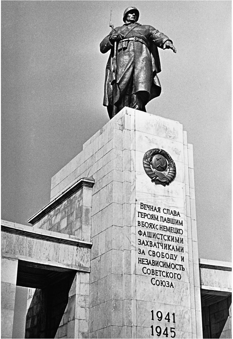
Sowjetisches Ehrenmal im Tiergarten, April 1947.