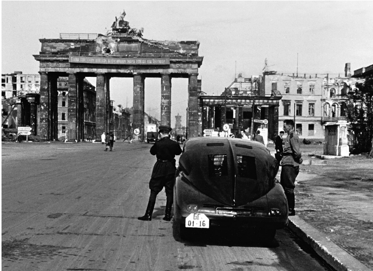
Sowjetische Soldaten vor dem Brandenburger Tor, März 1946.

denzweude war der nach dem damaligen amerikanischen Außenminister benannte »Marshall-Plan«. Obwohl die Finanzhilfen des European-Recovery-Programms sämtlichen Staaten »westlich von Asien«, wie es hieß, angeboten wurden, war es so angelegt, dass es letztlich für die Sowjetunion nicht infrage kam. Stattdessen nahm Moskau seine europäischen Verbündeten an die Kandare und nötigte sie ebenfalls zur Ablehnung des Hilfsprogramms.